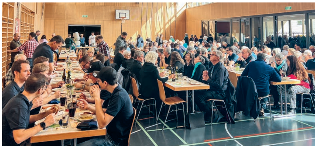
Impression vom Suppentag, 1. März

Am 24. April treffen wir uns wieder zum «Mittwochs mitenand» im Gruppenraum. Herzliche Einladung!