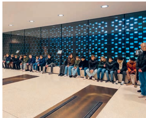
Schüler*innen der 2. Oberstufe Kirchberg besuchen das Krematorium in St. Gallen.