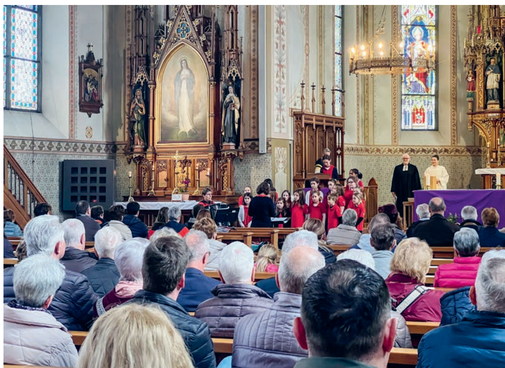
Impression vom Suppentag, 18. Februar.

Infos zur Durchführung immer aktuell auf: fg-bazenheid.ch