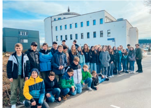
Schüler*innen der 1. Oberstufe Kirchberg besuchen die Moschee in Wil.