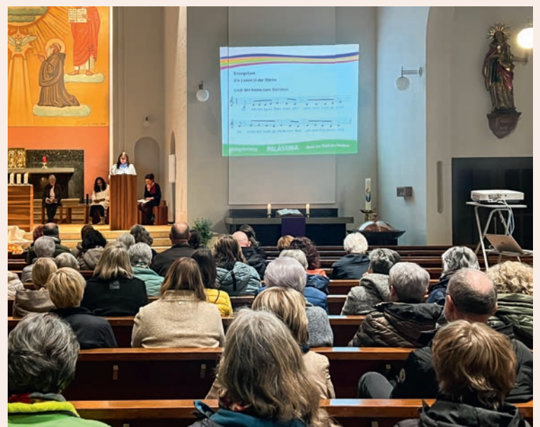
Impression vom ökumenischen Weltgebetstag, 1. März

Vom Markstag, dem 25. April, bis zum Tag der Kreuzerhöhung am 14. September erbitten wir in den Messen den Wettersegen – eine kostbare Tradition.