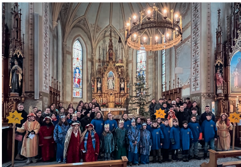
Eine grosse Schar Jungwachtbuben und Blairingmädchen freuten sich auf das Sternsingen. Sie durften den schönen Betrag von Fr. 2829.75 sammeln.